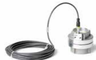
STORZ mit Endschalte